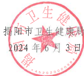
揭阳市卫生健康局