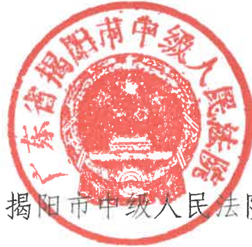
揭阳市中级人民法院