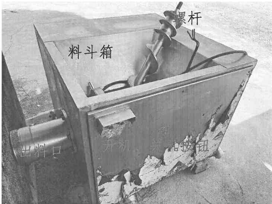
图 4 涉事设备 [11]

原料倒入倒梯形料斗箱，依靠螺杆将料斗箱中的原料推到预切板处，通过螺杆的旋转挤压，同时孔板与绞刀相对运转，使原料形成颗粒状并从出料口输出。