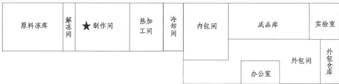
图 1 厂房空间布局

热加工间、冷却间、内包间、成品库、外包间、外包仓库、实验室等车间。生产加工流程：1. 肉类原料存放于原料冻库（采取氟利昂制冷方式）；2. 取出在解冻间解冻；3. 在制作间制作成型“潮汕卷章”；4. 在热加工间利用电热锅将“潮汕卷章”油炸熟化处理；5. 在冷却间利用空调自然冷却；6. 在内包间将成品真空包装；7. 存放于成品库。