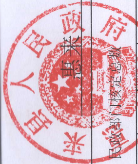
县乡镇和建制村通硬化路和通客车数据情况汇总表